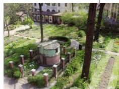
VEDUTA DALL'ALTO DEL SETTORE ORIENTALE DELL'ORTO BOTANICO DI BRERA, CON LA CUPOLA ASTRONOMICA E LA PRIMA VASCA ELLITTICA