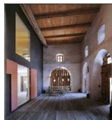
INTERVENTO IN CHESA MEGEDINA, LA FONTE, 1999