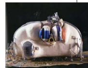
DAVID GREEN, LIVING POD, 1966 FOTO DEL MODELLO